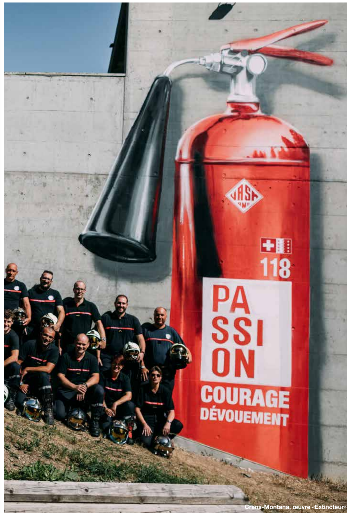
Crans-Montana, œuvre «Extincteur»

ont participé à l'atelier au cœur de la ville de Sion