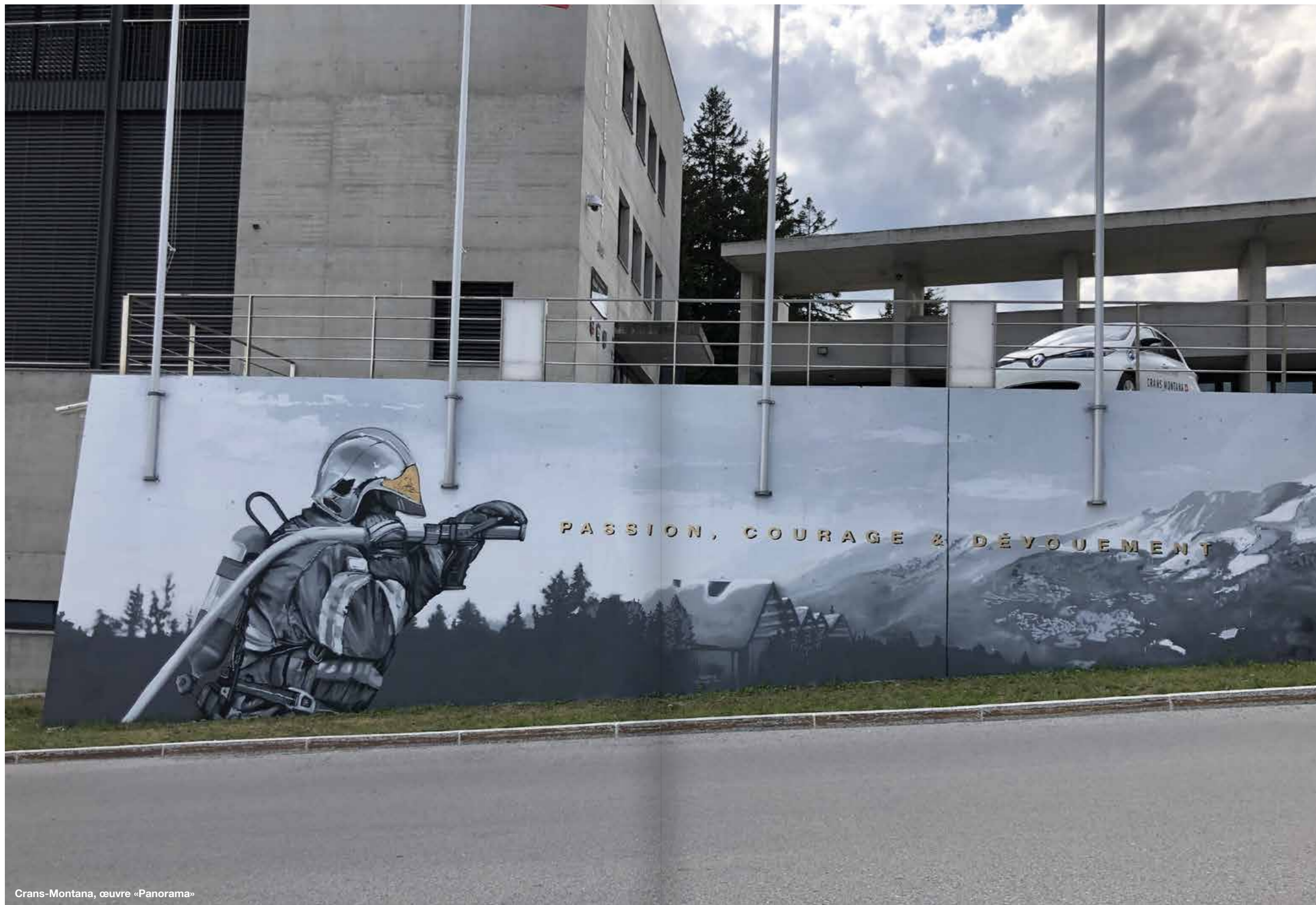
Crans-Montana, œuvre «Panorama»