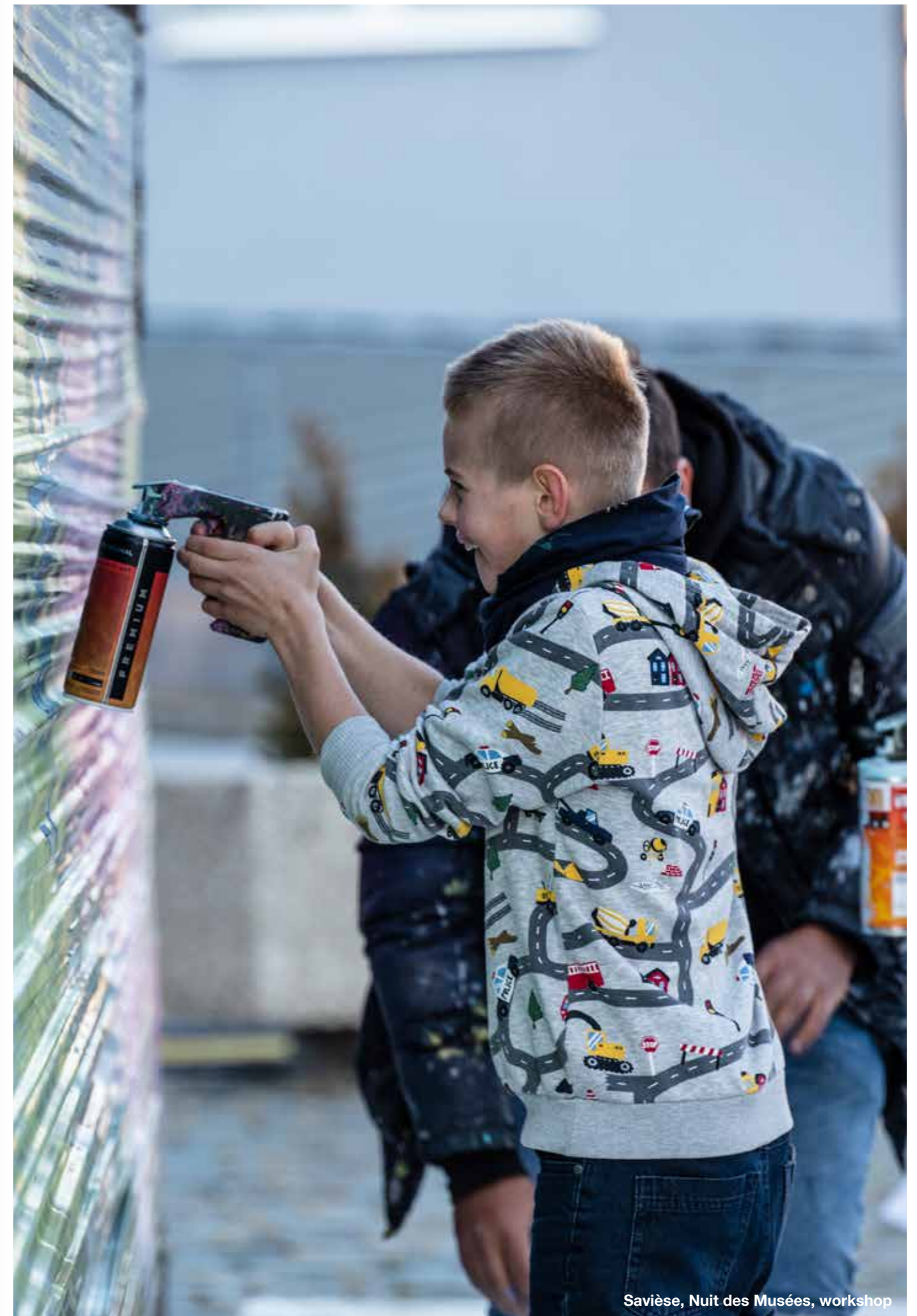
Savièse, Nuit des Musées, workshop