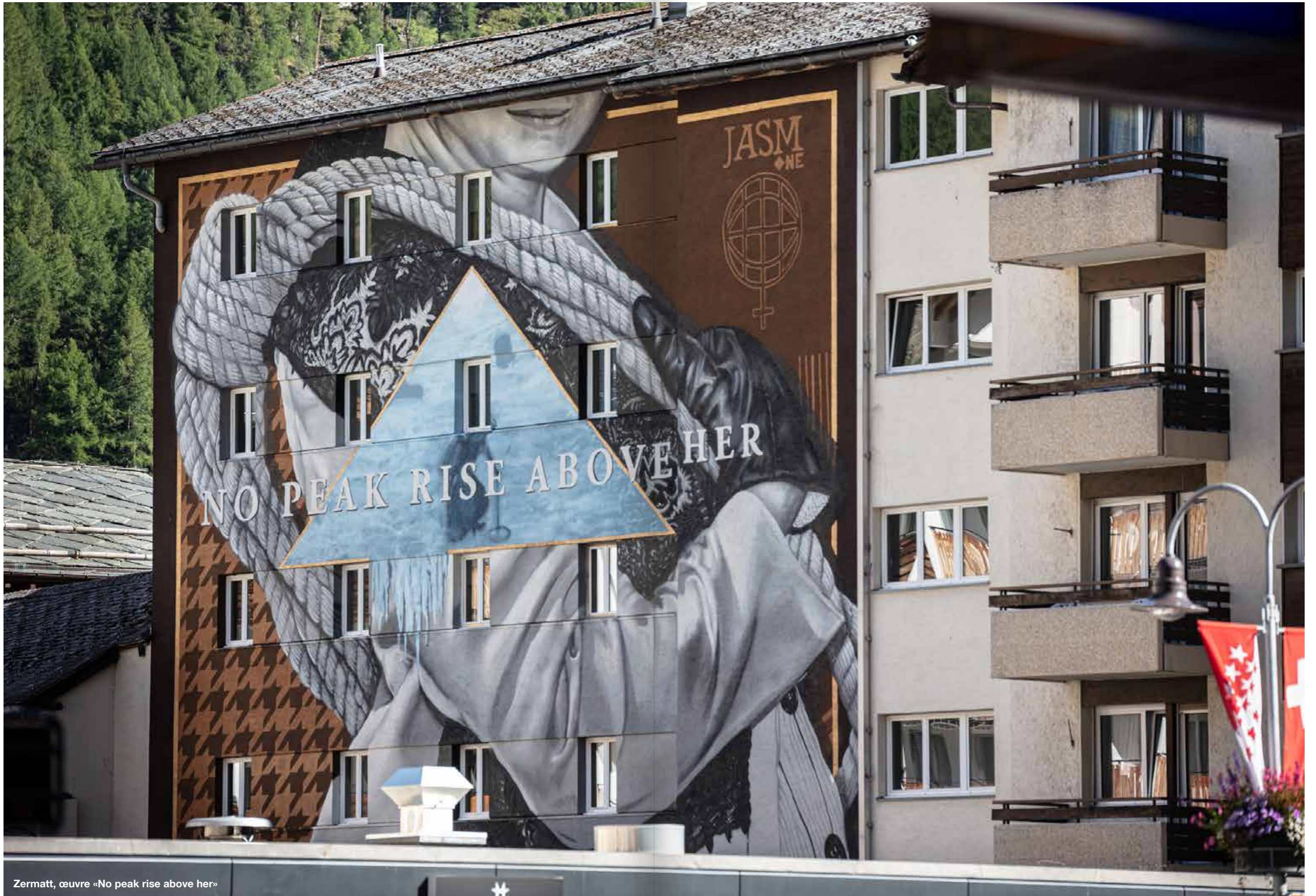
Zermatt, œuvre «No peak rise above her»