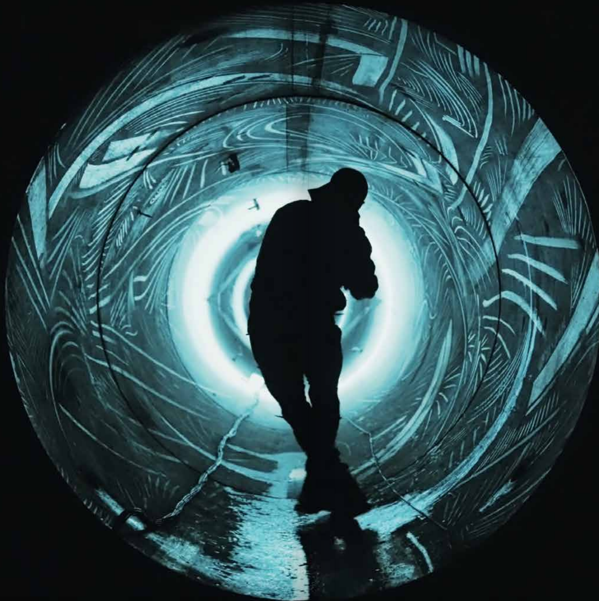
Sion, Olken œuvre «Rainbow»