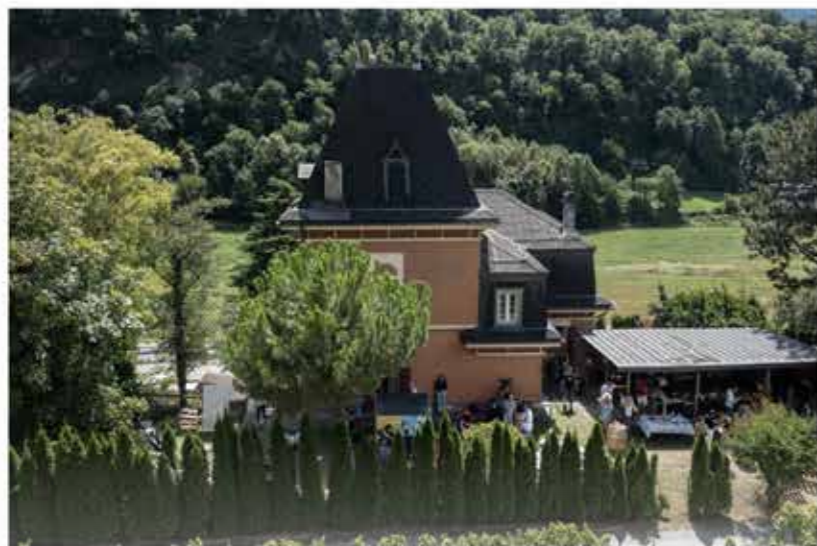
© Thierry Sermier / Art Valais

Imaginez un domaine de 24 hectares. A flanc de colline, une bâtisse de 200 m2, construite au XIX ème siècle. Situé au cœur du Mont d'Or, réputé comme l'un des plus prestigieux vignobles de Suisse, ce manoir accueille désormais des artistes internationaux : petits veinards !