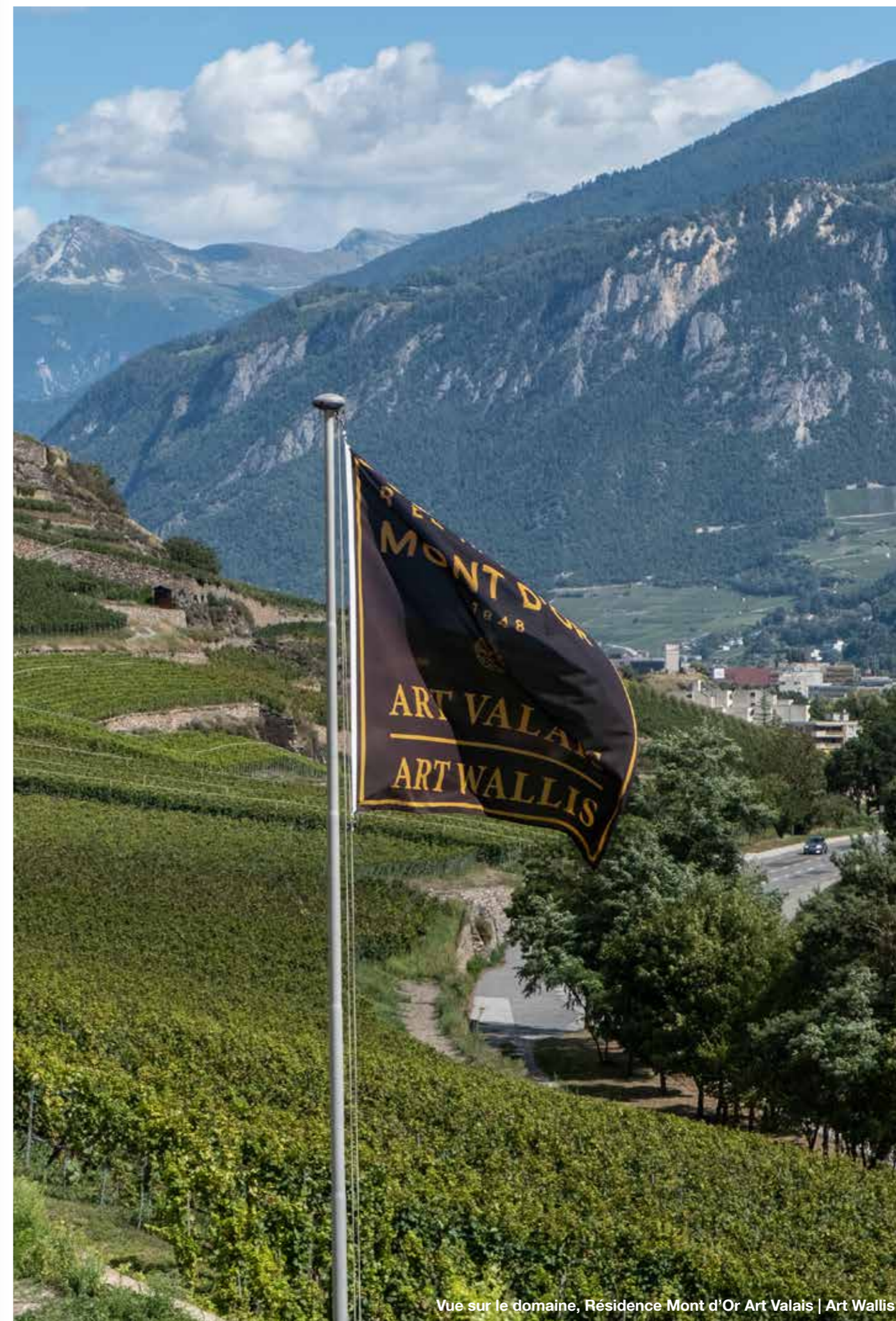
Vue sur le domaine, Résidence Mont d'Or Art Valais | Art Wallis

Au total, ce sont plus de 500 visiteurs, venant des quatre coins de la Suisse qui ont participé aux activités Art & Vin proposés par la Résidence et le Domaine du Mont d'Or.