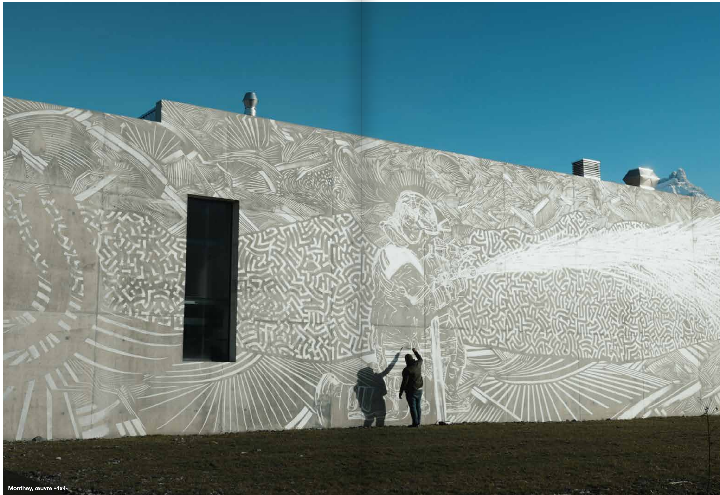
Monthey, œuvre «4x4»