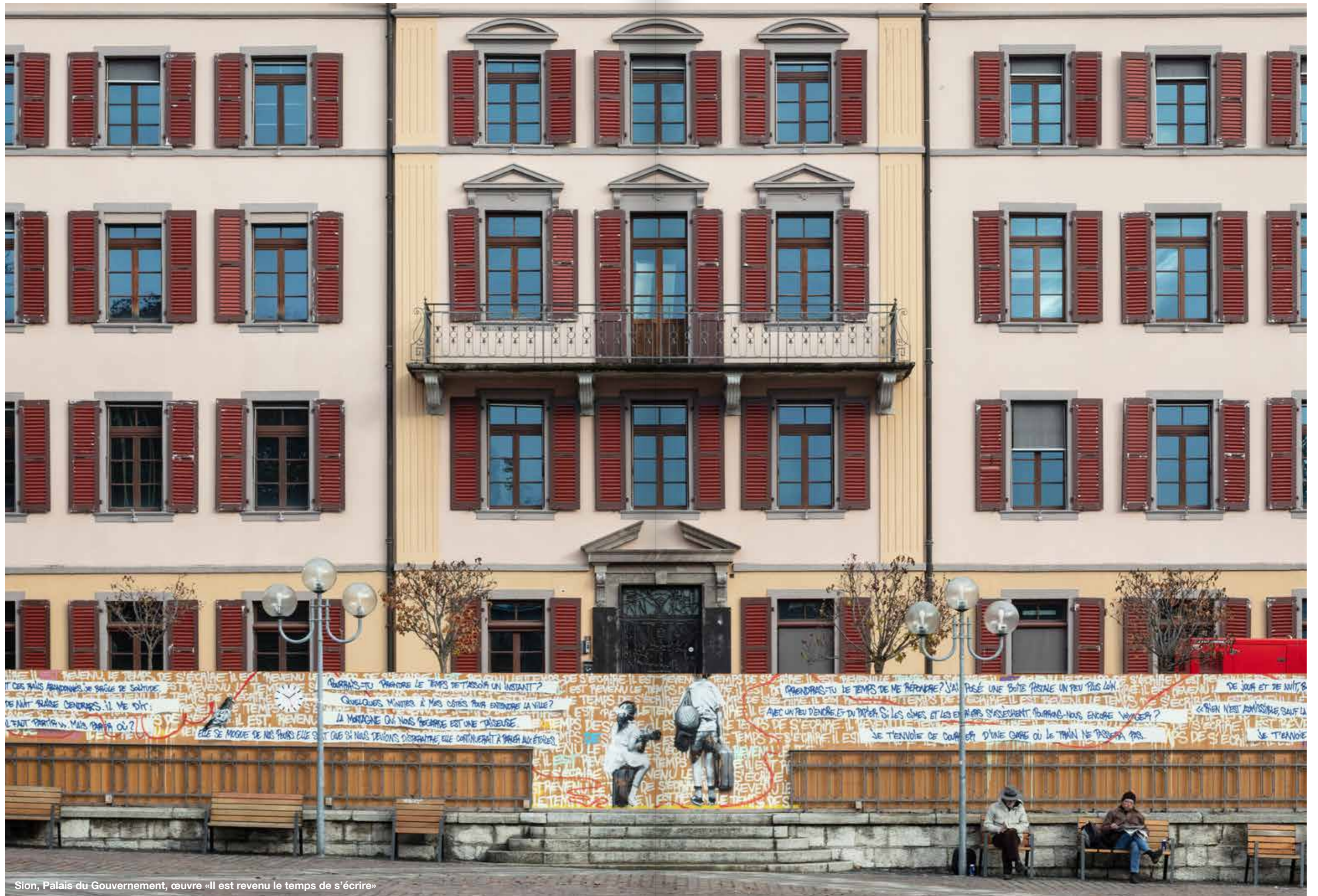
Sion, Palais du Gouvernement, œuvre «Il est revenu le temps de s'écrire»