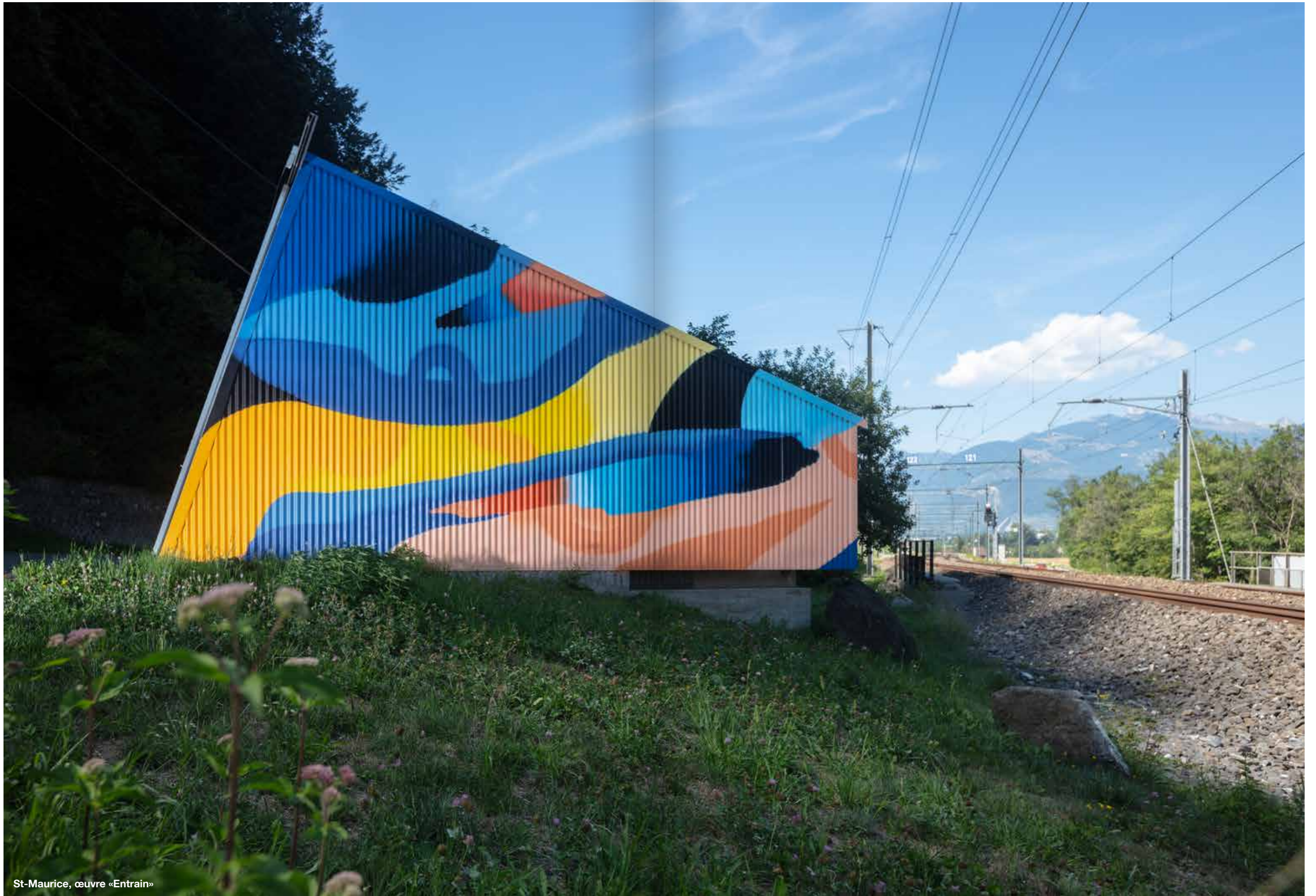
St-Maurice, œuvre «Entrain»