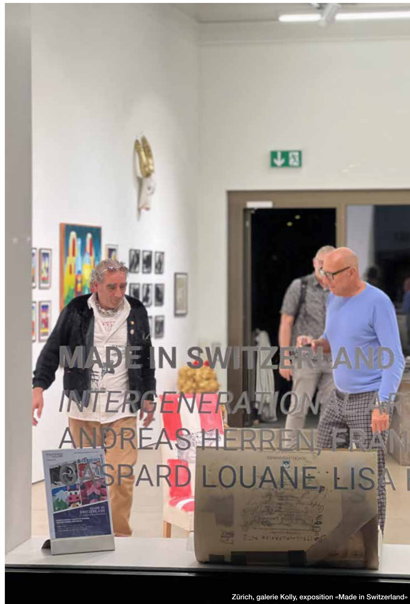
Zürich, galerie Kolly, exposition «Made in Switzerland»

La mise en place du projet avec ses réflexions, sa demande de permis de construire et le développement du concept ont débuté en fin d'été avec les membres de la fondation. La réalisation du projet est prévu pour l'été 2023.