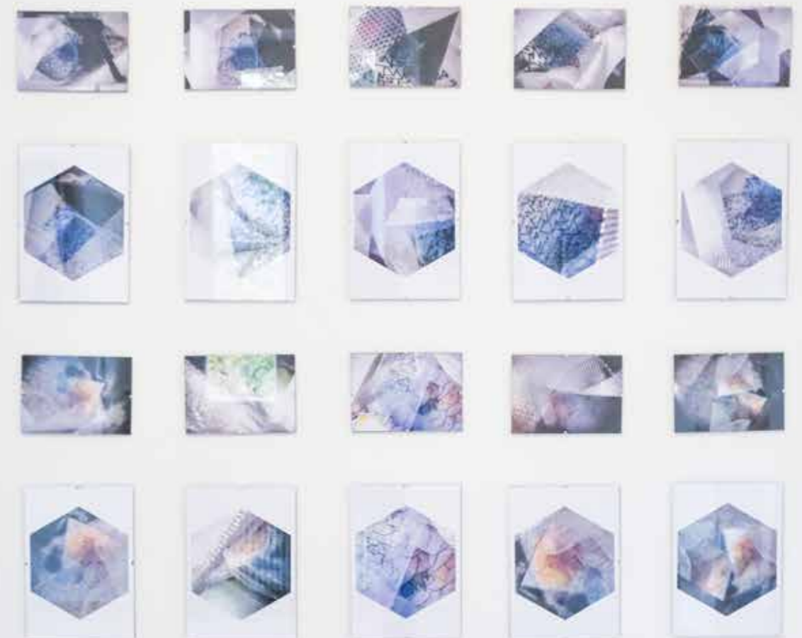
Résidence Mont d'Or Art Valais | Art Wallis, exposition «I dr Chiste / Dans la boîte», oeuvres photographiques de Thierry Sermier

Un brunch artistique, le 4 septembre 2022, réunissant une centaine de personnes, adultes et enfants, ponctué de discussions facilitées avec les artistes, d'un café philosophe, de performances artistiques, d'une initiation au public et de musique.