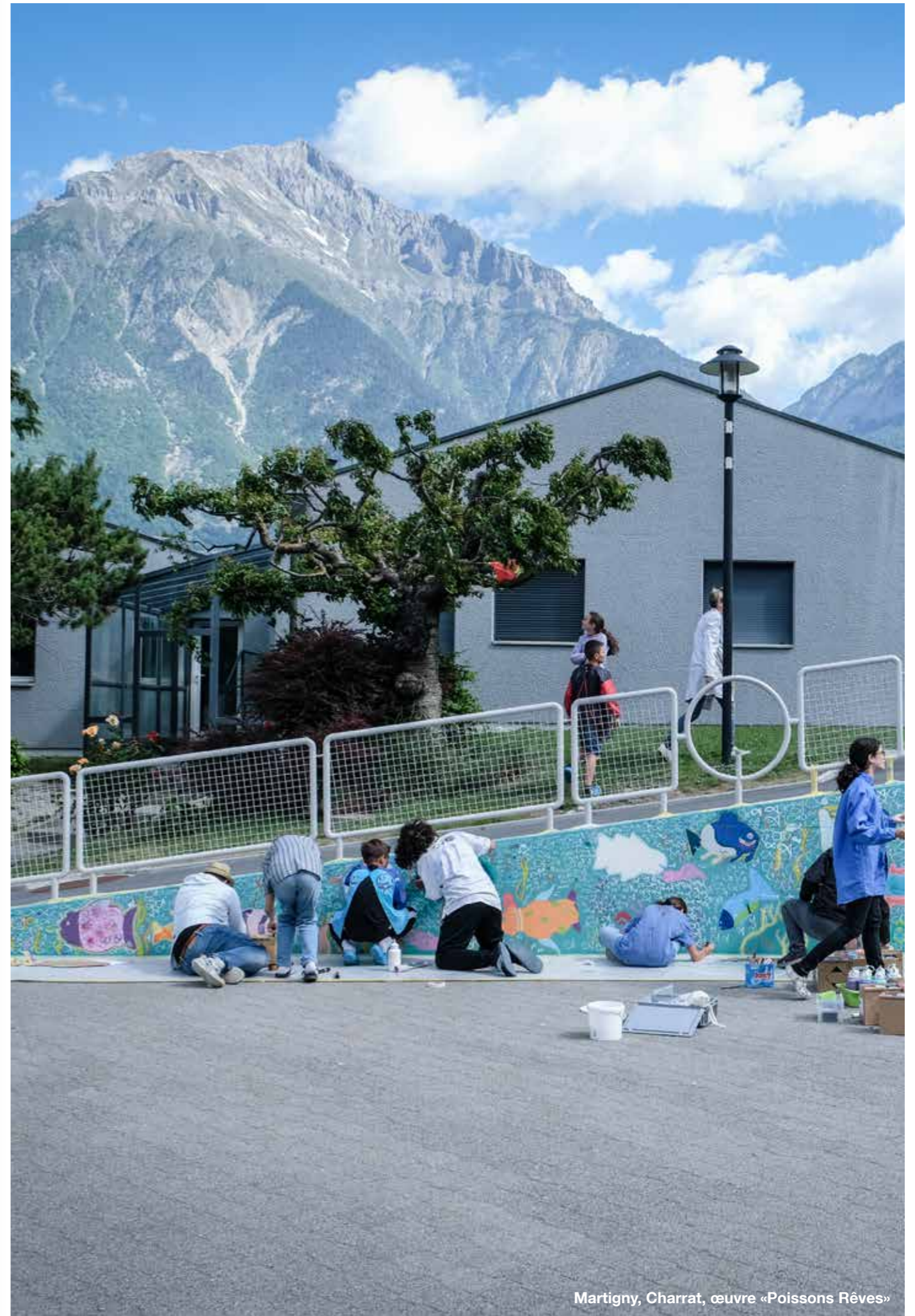
Martigny, Charrat, œuvre «Poissons Rêves»