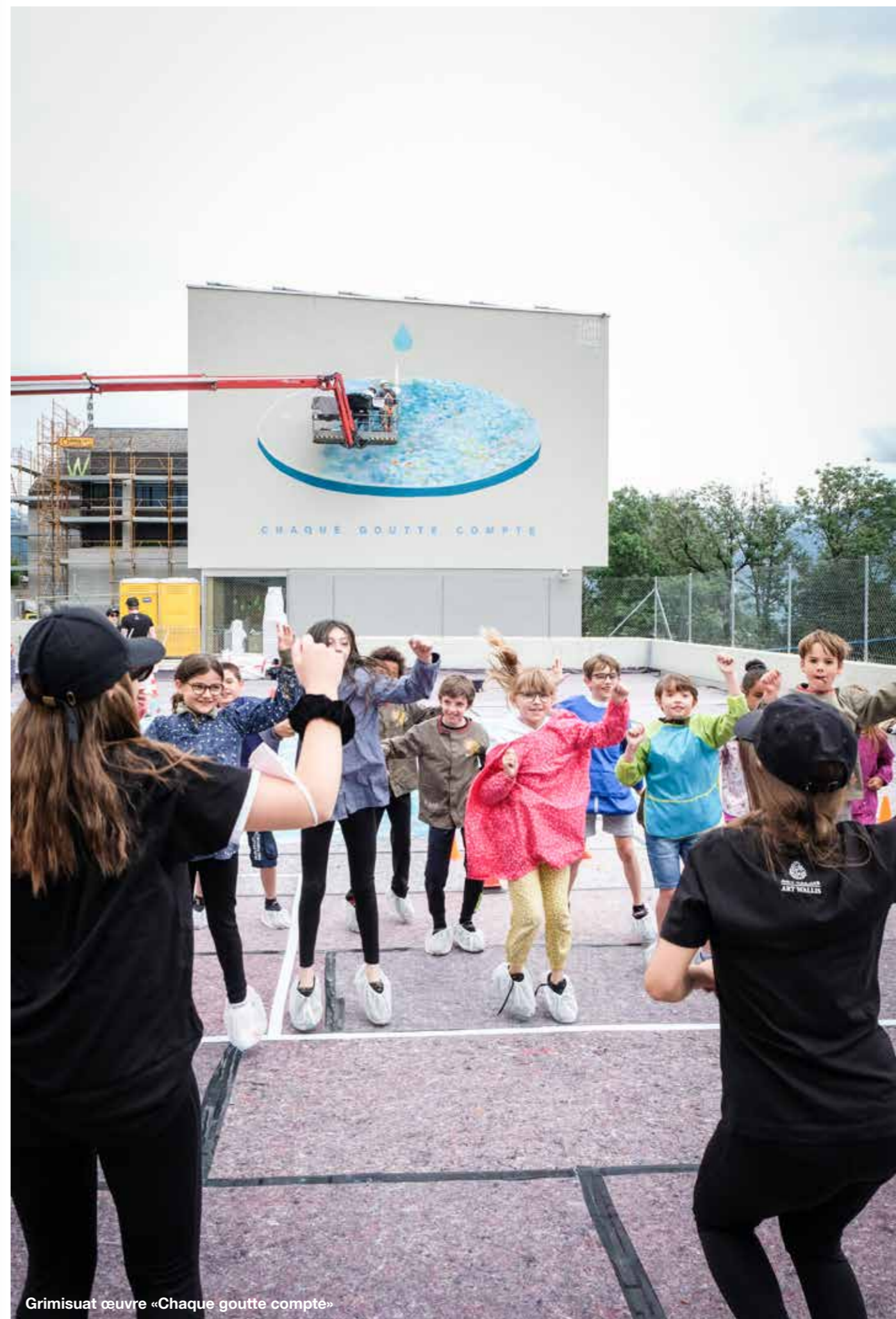
Grimisuat œuvre «Chaque goutte compte»

pour valoriser la préservation de l'eau et l'enjeu communautaire