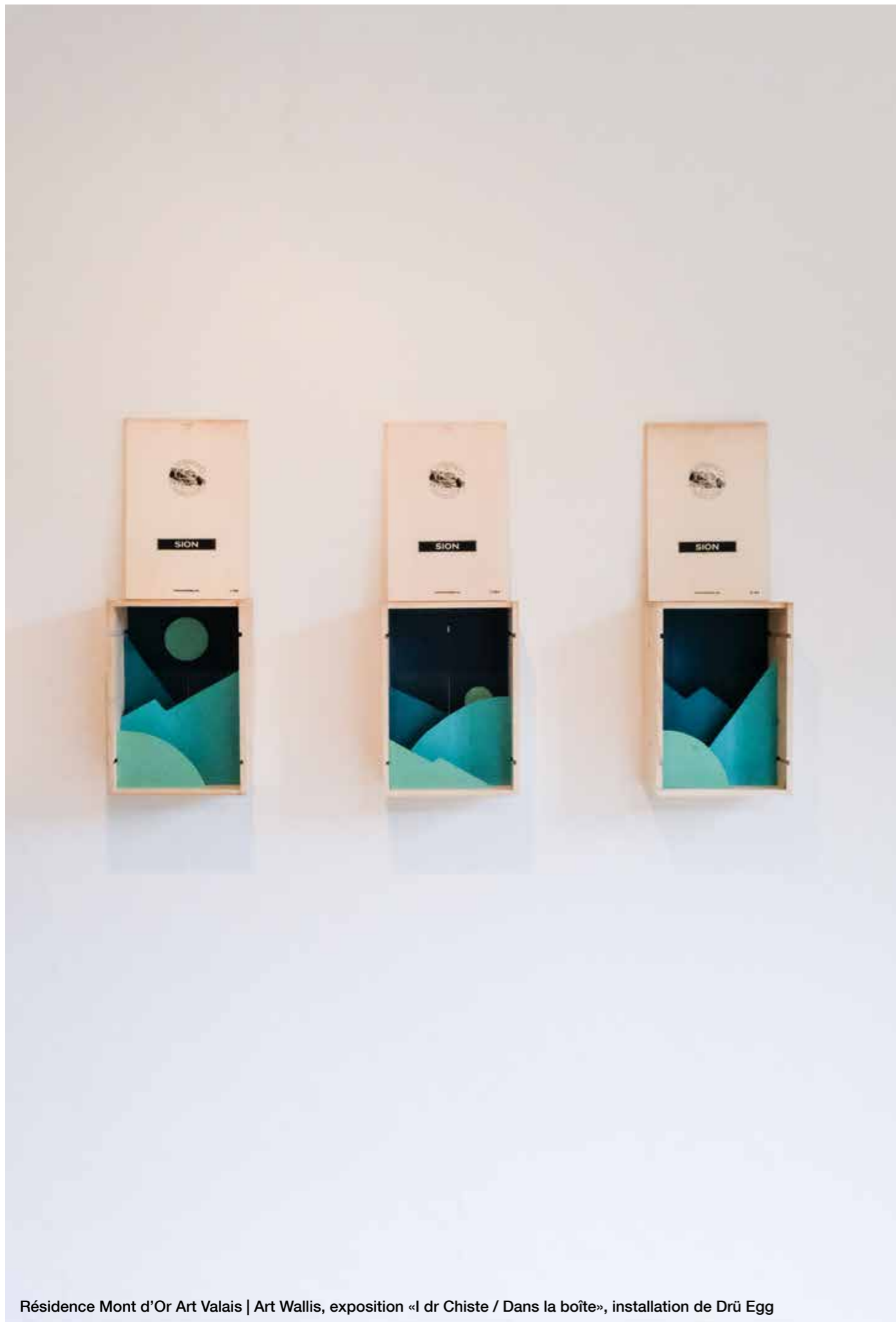
Résidence Mont d'Or Art Valais | Art Wallis, exposition «I dr Chiste / Dans la boîte», installation de Drü Egg