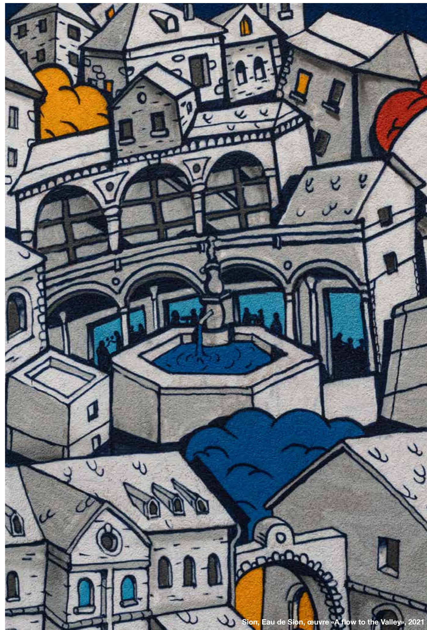
Sion, Eau de Sion, œuvre «A flow to the Valley», 2021

Les fontaines d'eau potable et historiques sont recensées et présentées sur l'application mobile AWW.