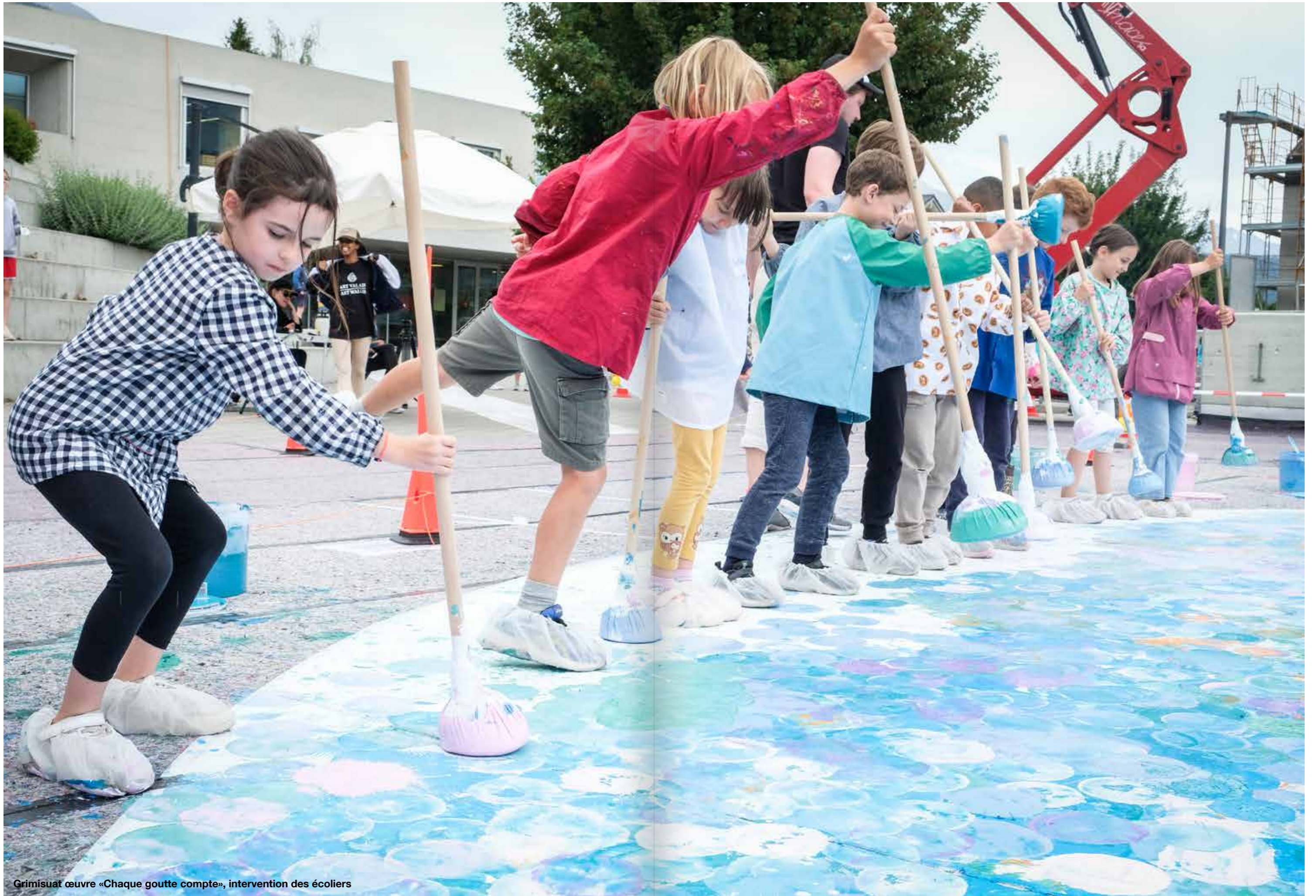
Grimisuat œuvre «Chaque goutte compte», intervention des écoliers